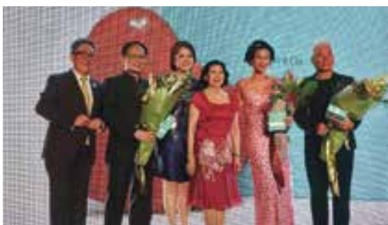
2016年为众圣之家筹款演出。