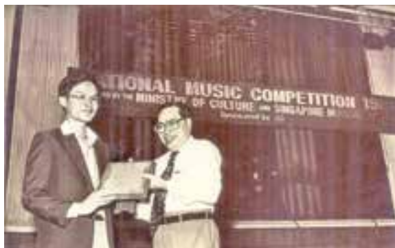
1981年荣获全国音乐比赛钢琴公开组冠军与全场最佳演奏奖。

人想成功，成功者寥寥。一个人能在某一个领域取得成功已属不易，能在多个领域留下浓墨重彩的一笔，就更为罕见了。