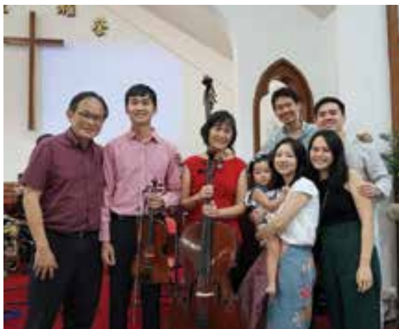
2023年底陈志群合家崇拜后摄于长老会荣耀堂。

具有历史意义的第一张新谣专辑“明天21”于1984年发行后大受欢迎，销量惊人。陈志群一炮而红，马不停蹄地参与了多张新谣与流行音乐专辑和电视剧主题曲/插曲的编曲。1984至1990年的短短6年间，编