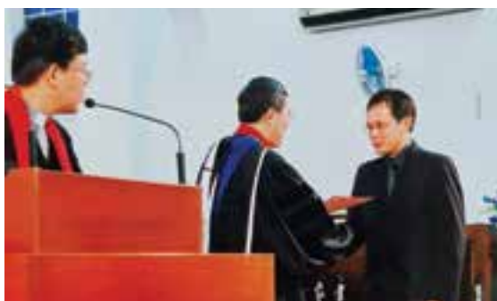
2004年被按立为长老会荣耀堂长老。

2019年中，在一次教会的营会中，他虔诚祷告，求上帝显明旨意。奇妙的是，营会还没结束他就接到一位长老的电话，说众圣之家在招聘总